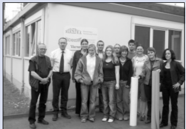
Die Exkursionsteilnehmerinnen und -teilnehmer zur in unmittelbarer Nachbarschaft zum Campus gelegenen Mersepack GmbH