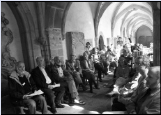
Die Teilnehmerinnen und Teilnehmer während des Vortrages von Dr. Bernd Janson, Kanzler der Hochschule Merseburg (FH)

Evangelische Studentengemeinde lud ihre Ehemaligen ein