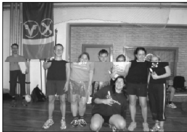
Dritter Platz im Volleyballturnier des Anfängerkurses: Die Protegeros de la Tortuga.