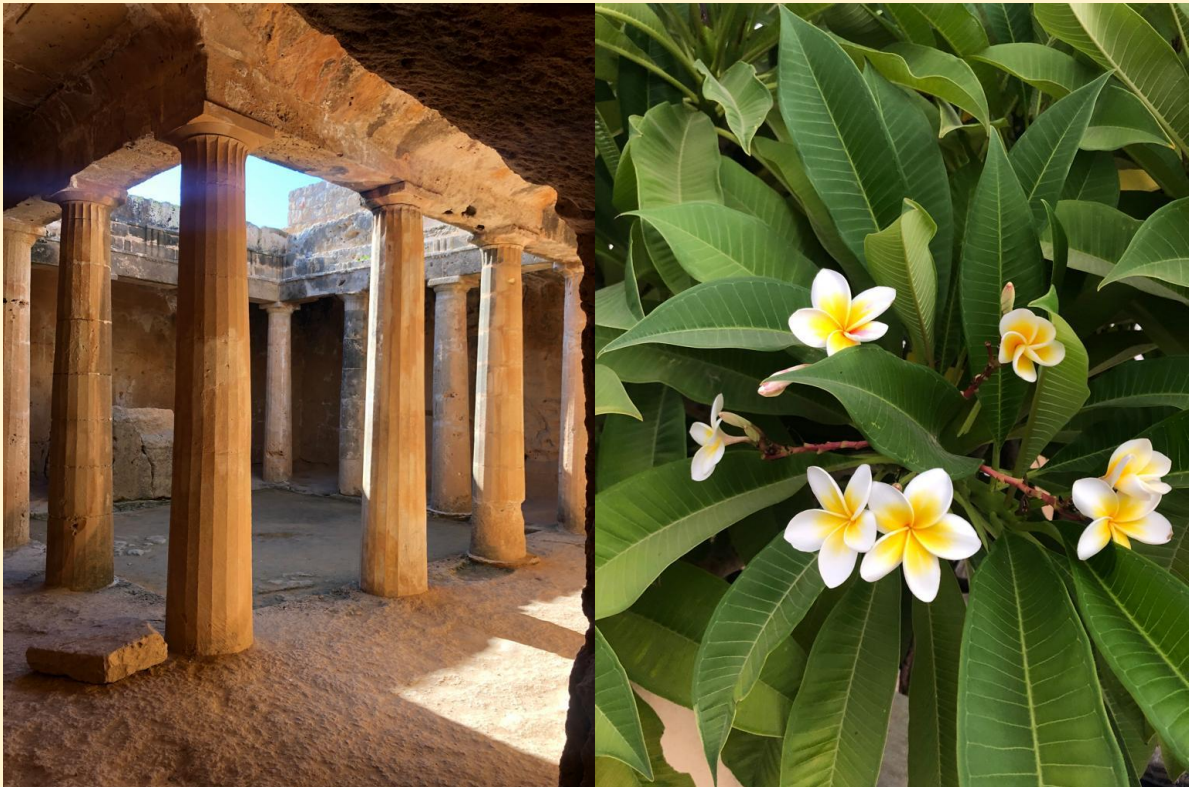
(Königsgräber in Paphos)

Zypern verzaubert mit seinen wunderschönen Stränden und interessanten Städten, die man leicht mit dem Bus erreichen kann.